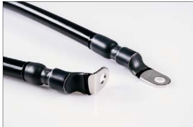
SA47-LA, gaine thermorétractable, idéale pour les connecteurs de câbles.

Disponible également en manchons sur demande. Contactez-nous !