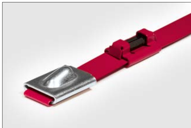
MBTRFID - Bridas de Acero Inoxidable RFID para identificación de productos en entornos severos.